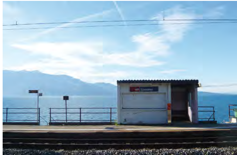
Discrète, suspendue entre vignes et lac, la gare d'Epesses

Elles ne doivent pas être bien nombrées les communes pouvant se targuer d'abriter quatre gares sur leur territoire.